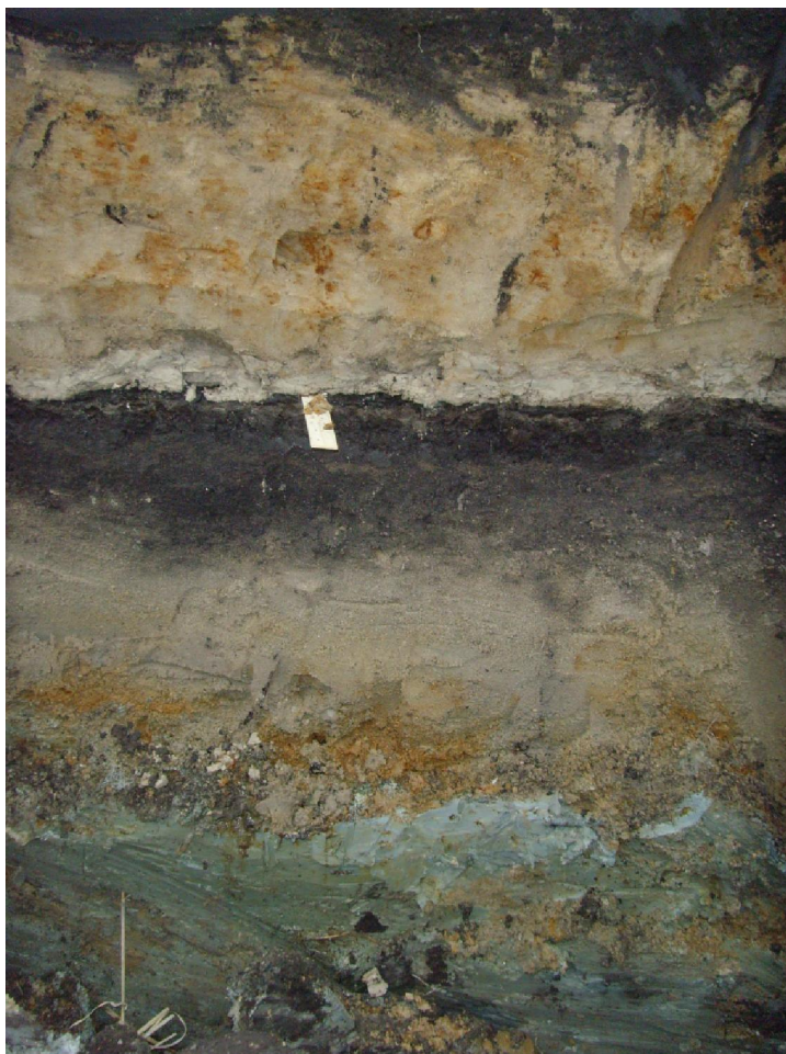
Figur 3. Det övertransgredierade organiska lagret (svarta randen) i schakt 22000

Totalt dokumenterades 8 sektioner i två längre schakt (OS22000 respektive OS22052). I båda schakten kunde kontinuerligt följas en övertransgredierad markyta representerad av ett oftast mörkare brunt organiskt och ställvis torvigt lager (under stickan i figur 3). I schakt OS22000 inmättes längst i väster (punkt 22046, överytan på detta torvlager till 1,236 m ö. h. för att gradvis stiga mot öster till 1,706 m ö. h. i punkt 22049. I det norra schaktet, OS22052, återfanns den övertransgredierade markytan åter som ett mörkare lager som här dock bitvis främst utmärkte sig på sin rikedom av kolpartiklar. I detta schakt steg nivån för det övertransgredierade lagret från 2,370 m ö. h. i punkt 22063 till 3,221 m ö. h. i punkt 22060. Slutsatsen av detta lagrets utbredning och nivå är att en transgression kan följas från 1,24 m ö h upp till 3,22 m ö. h. I detta höjdintervall finns möjlighet att transgressionen kan representera antingen Ancylusskedet eller Littorinaskedet. För att snabbt bestämma vilket analyserades pollen och diatoméer från lagerföljden vid punkt 22046 i lagren intill transgressionssekvensen. Analyserna visade att det mörka lagret representerande tiden före transgressionen, att det var en gyttja