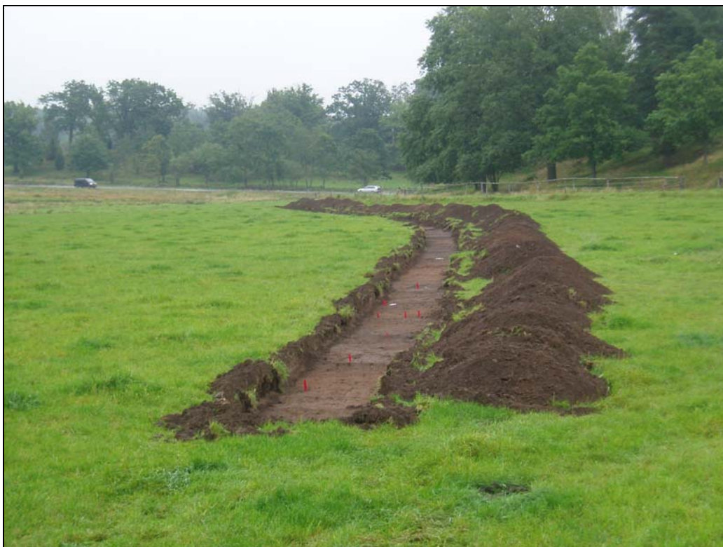
Bilaga 1b – Norra ledningsschaktet mot Ö.