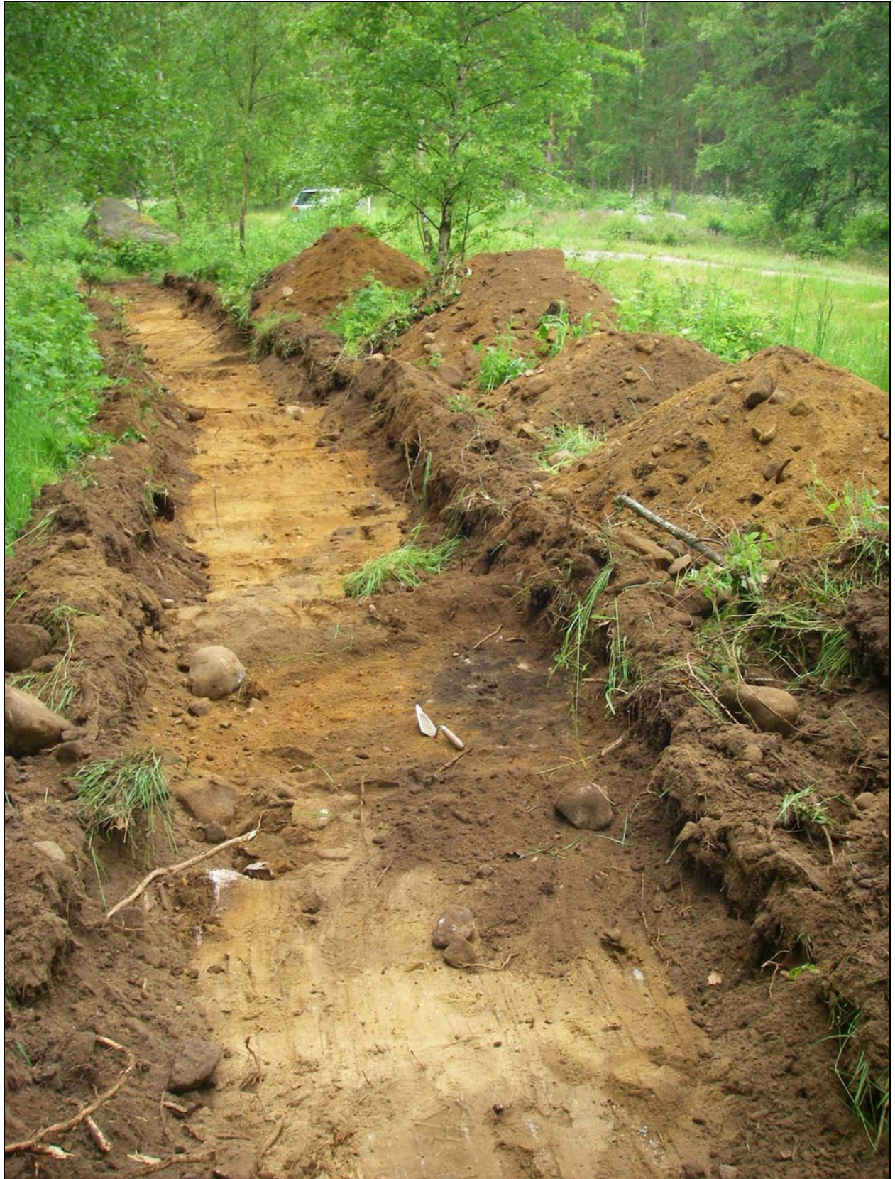
Överblick framrensad anläggning i Schakt 3 mot V.