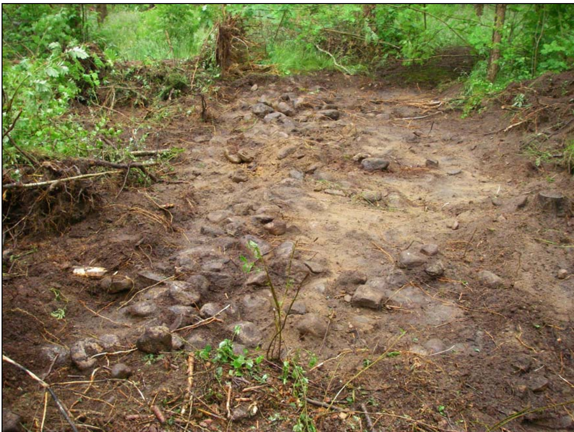
Överblick stensträn i S delen av Schakt 10.