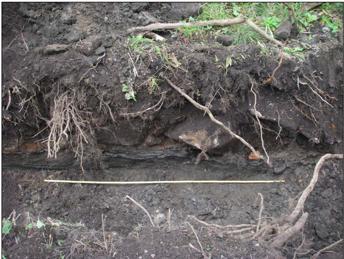
Sektion A-B mot NO.