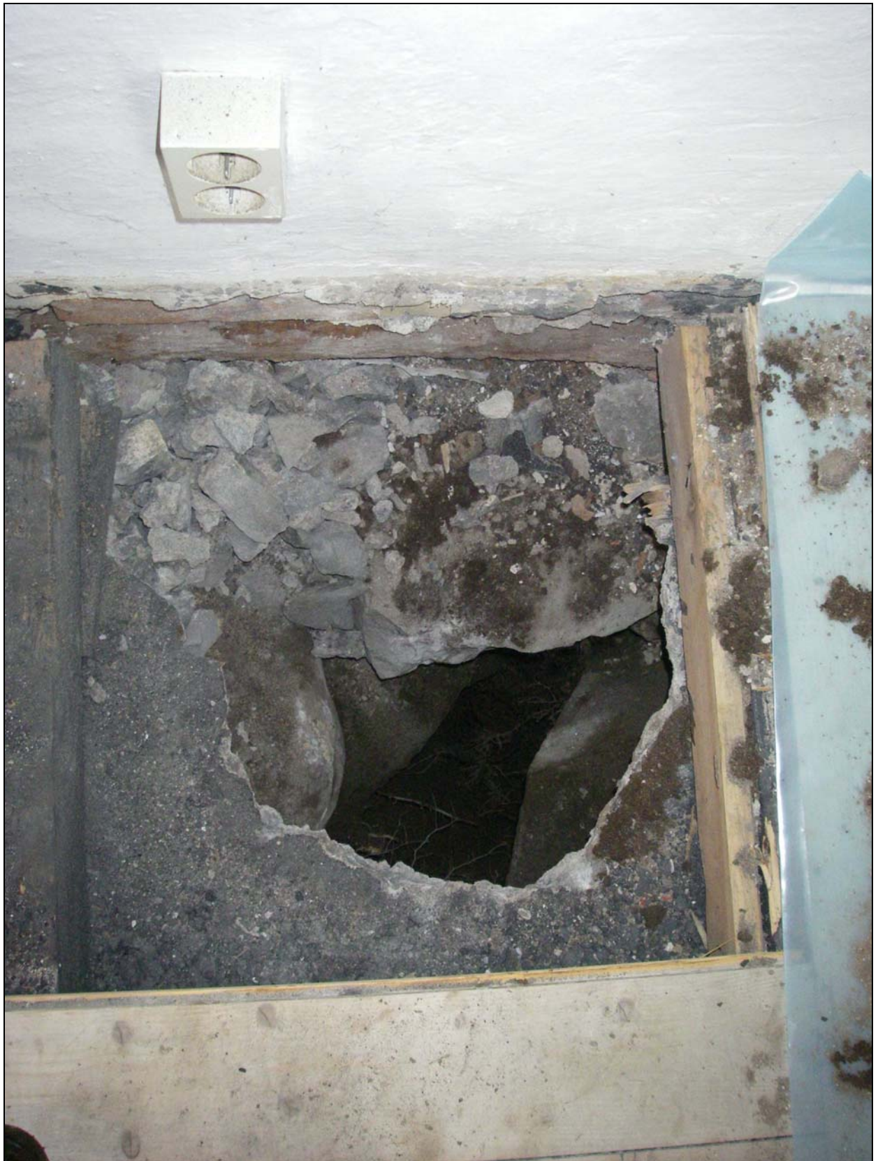
Uppbrutet golv vid sakristians östvägg