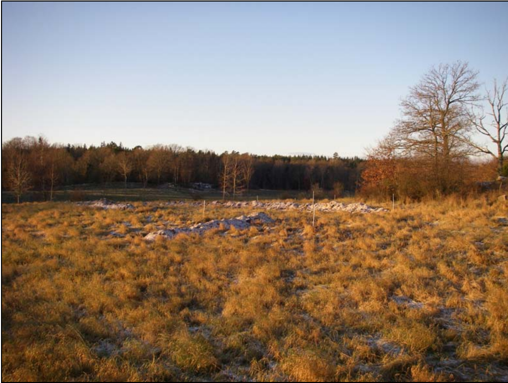
Fig.2 - Platäläget inom utredningsområdet, centralt i bilden schakt 4, 5 och 6 fotograferade mot SV.

Huvudsakligen bör därför fynd tillvaratagna ur källkritiskt säkerställda kontexter ligga till grund för den fortsatta uttolkningen av lokalen kulturhistoria. Ett flackt platäläge gränsar i söder mot en äldre sandtäkt, vilken numera är fylld med uppbruten och sprängd sten.