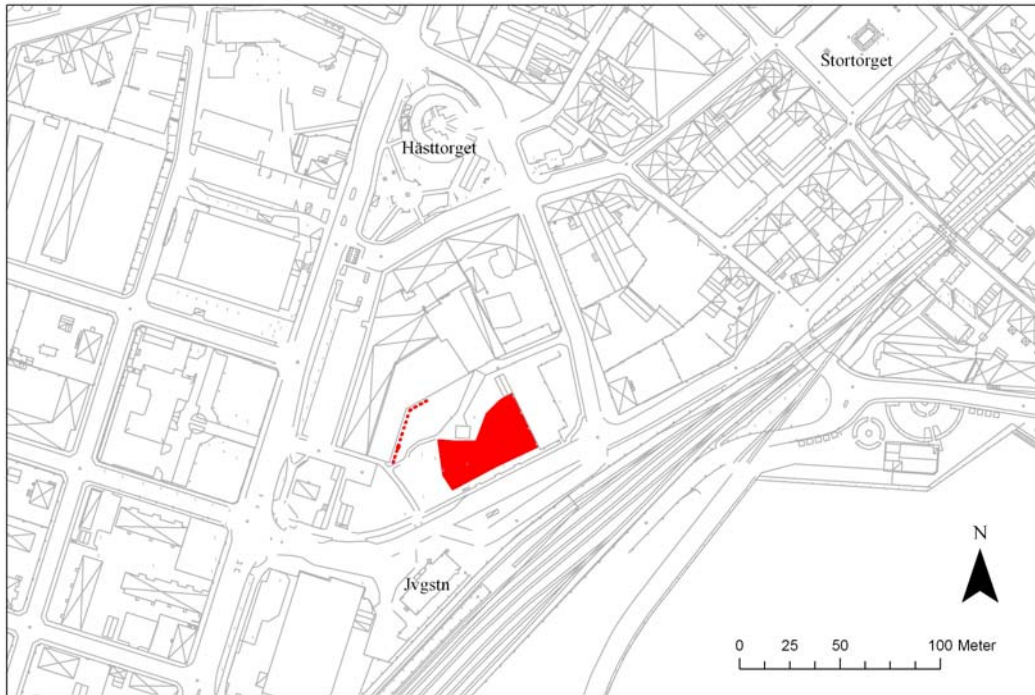
Undersökningsytorna i Järnvägsparken rödmarkerade