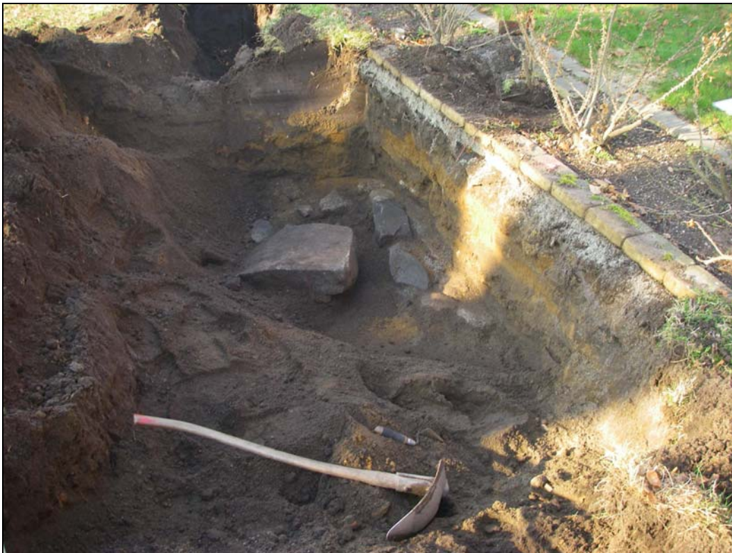
Stenläggning framrensad i anslutning till RAÄ 36 Sölvesborg.