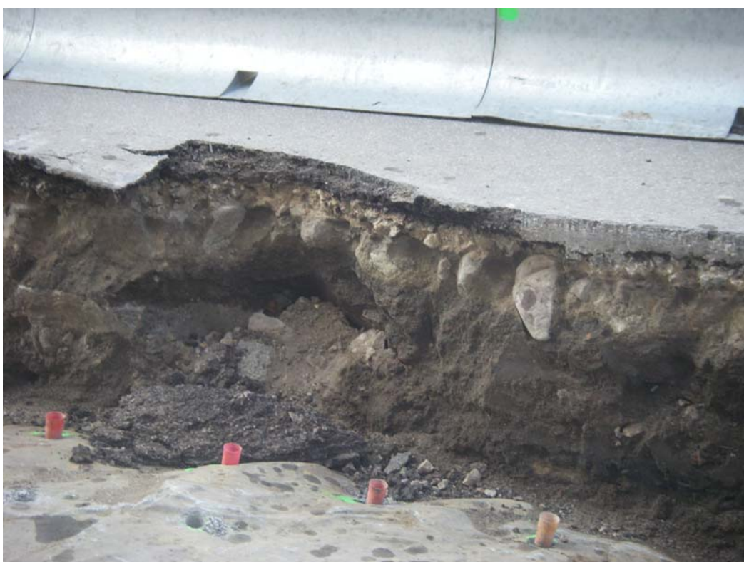
Figur 4. Arbetsrådets mellersta del. Mot Väster.