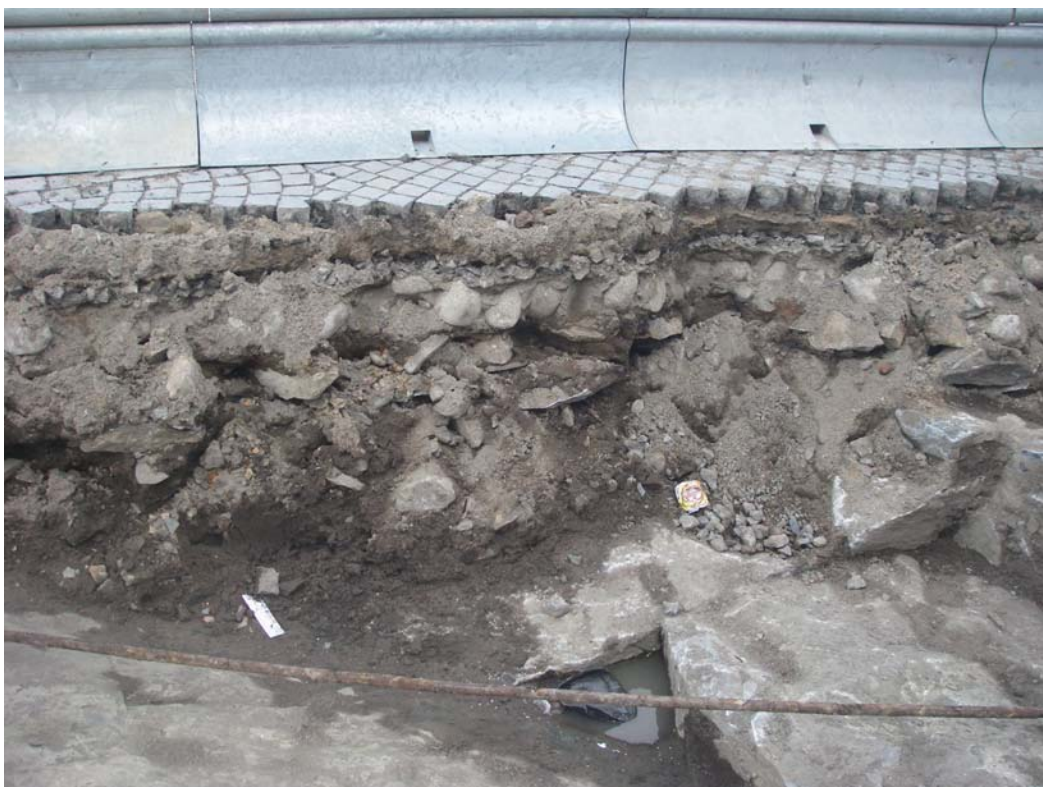
Figur 3. Lager i norra delen av undersökningsområdet. Mot väster.