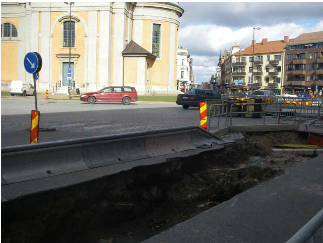
Figur 1. Arbetsområdet öster om Fredrikskyrkan. Mot norr.

Undersökningsområdet ligger i krönläge, och vid grundläggandet av Karlskrona hade hela området i stort berg i dagen. Fredrikskyrkan grundlades år 1720 på "hälleberget" (Hillbom 1979:39). Bilder från 1700- och 1800-talet visar en terräng som är mycket ojämn till skillnad från dagens asfalt och gatustensytor.