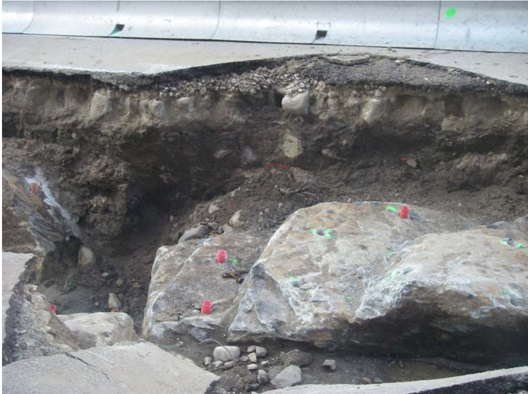
Figur 5. Arbetsområdet i söder. Mot Väster.