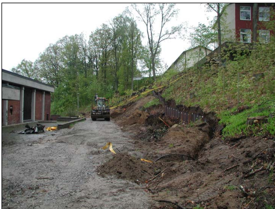
Fig.2 – Spont mot branten väster om simhallen.

Blekinge museums arbetsinsats utfördes i form av återkommande besiktningar av det fortlöpande arbetet på platsen. En inledande samverkan med exploitören och dokumentation av planområdet skedde 2006-04-04. Den direkta schaktövervakningen inför spontning, koncentrerades först till den västra sidan av den befintliga byggnadskroppen 2006-05-19. Avslutningsvis grävdes sedan ett 7 m 2 stort provschakt direkt söder om simhallen 2006-06-28. Arbetet dokumenterades genom fotografering med digitalkamera.