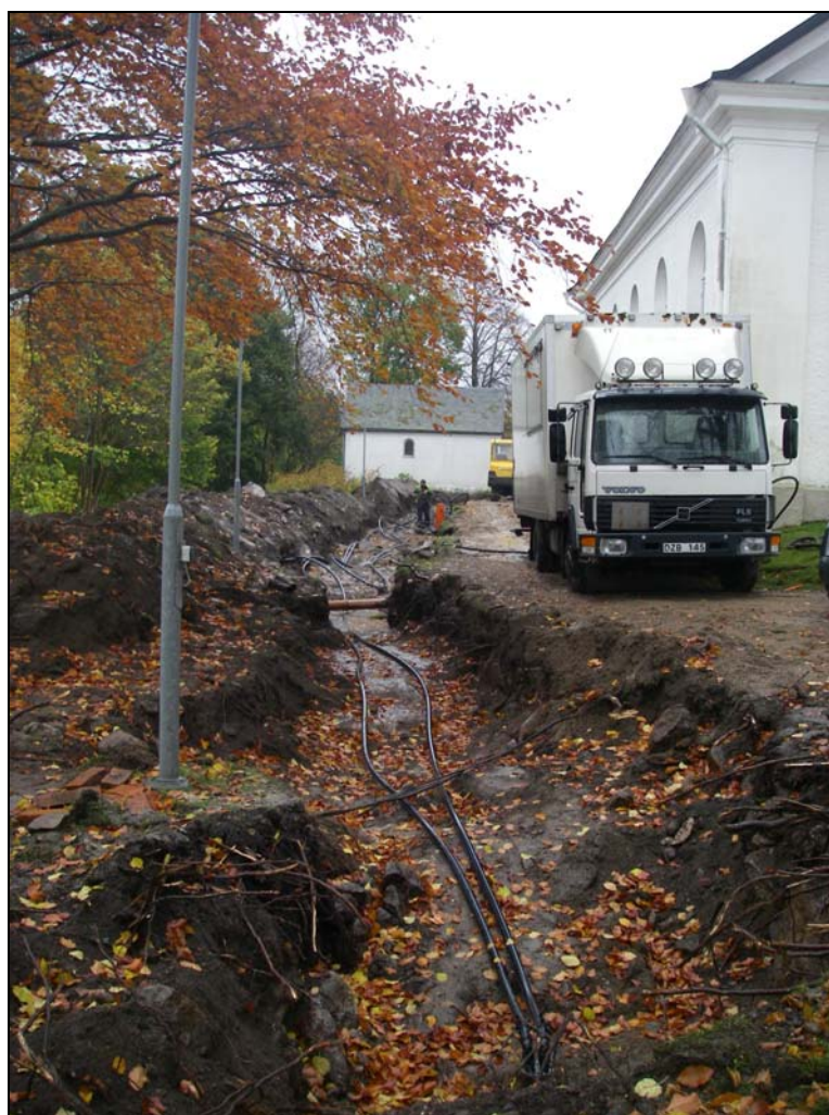
Överblick ledningsschakt mot SO.