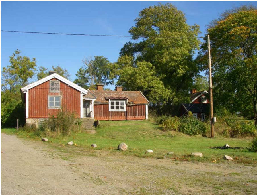
Fig.2 - Befintlig byggnad inom exploateringsområdet.

Utredningen inleddes med jämförande studier av arkivaliskt material i Blekinge museums arkiv samt analys av historiskt kartmaterial. Härefter genomfördes en inledande fältbesiktning 2009-10-06, vilken följdes av en mer ingående sådan 2009-10-20. Efter samråd med länsstyrelsen utgick fältarbetets planerade söschaktning. I samband med besiktningarna dokumenterades kulturmiljön fotografiskt med digitalkamera.