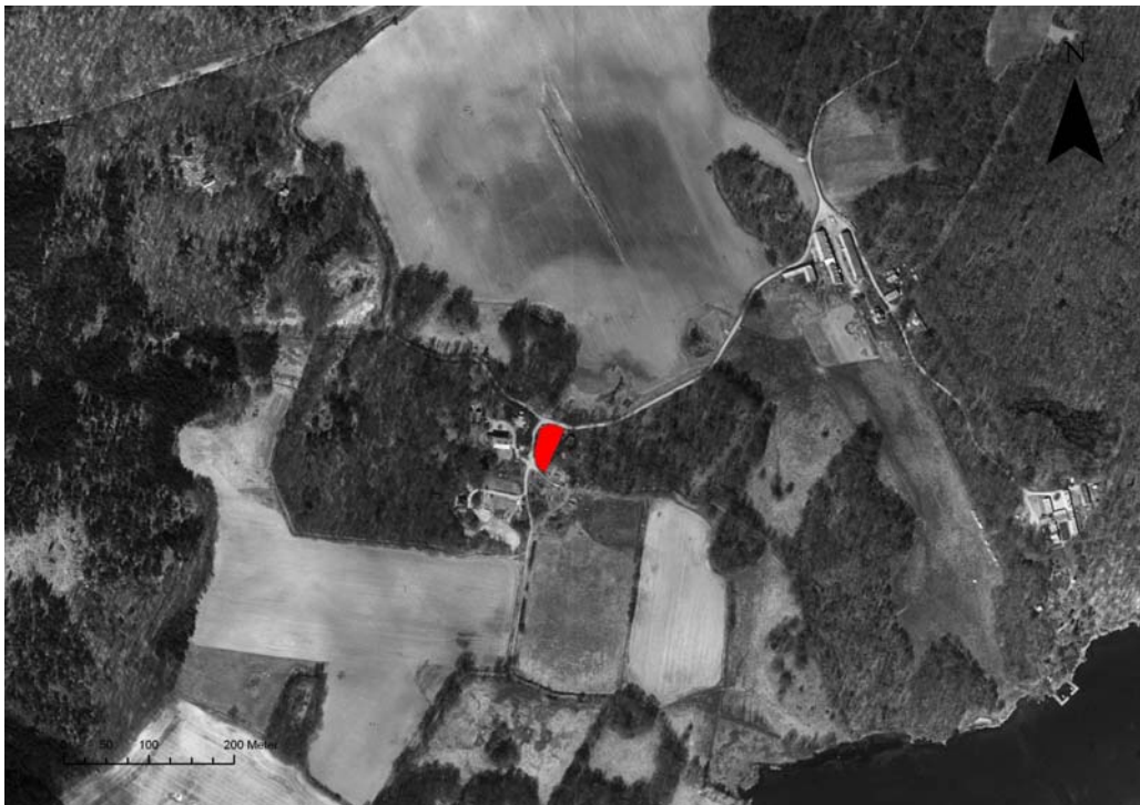
Fig.1 – Utredningsområdet markerat på fastighetskartan.

Inför en planerad nybyggnation av ett enbostadshus inom fastigheten Verstorp 2:20, uppdrog länsstyrelsen åt Blekinge museum att utreda den antikvariska situationen inom planområdet. Länsstyrelsen utförde av denna anledning en särskild utredning inom området under oktober 2009. Föreliggande avrapportering utgör en redovisning av det utförda uppdraget, vilket bekostats av länsstyrelsen genom 7:2-anlaget.