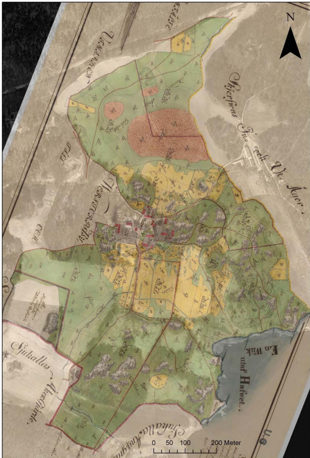
Bilaga 1 - Digitalt kartöverlägg 1786 års storskifte/modernt ortofoto.